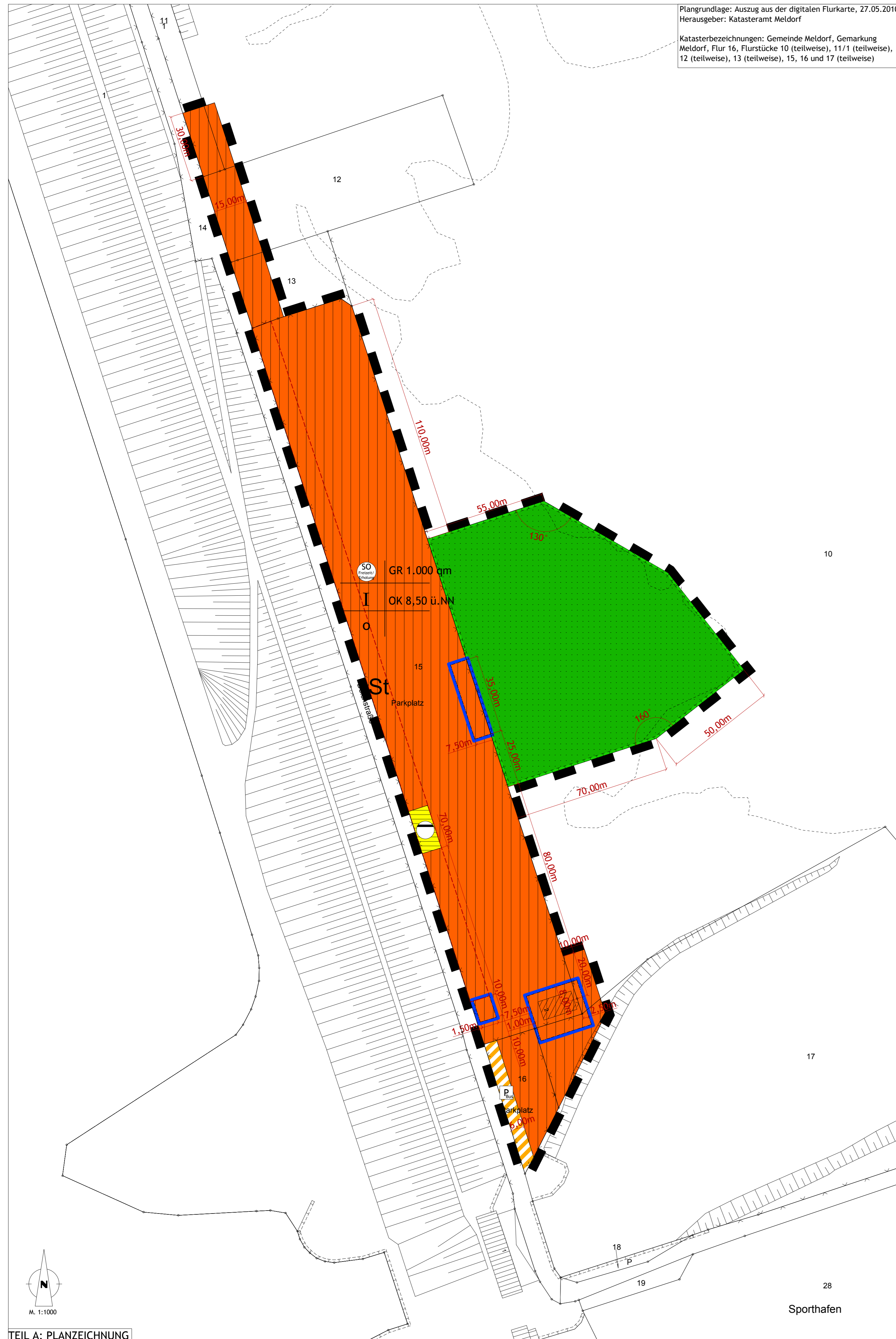
TEIL A: PLANZEICHNUNG

Aufgrund des § 10 des Baugesetzbuches (BauGB) sowie nach § 84 Abs. 3 der Landesbauordnung LBauO-SH wird nach Beschlussfassung durch den Verwaltungsrat vom ..... folgende Satzung über den vorhabenbezogenen Bebauungsplan Nr. 61 für das Gebiet "östlich der Deichstraße und westlich des MieleSpeichers" bestehend aus der Planzeichnung (Teil A) und dem Text (Teil B), erlassen: